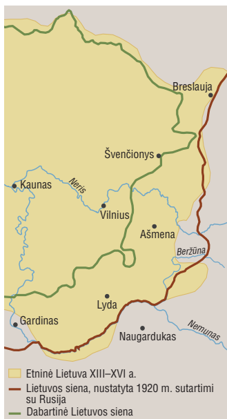
ETNINĖS LIETUVOS PIETRYTINĖS RIBOS XIII–XVI A.

Lietuvos ribos 1009-aisiais turėjo eiti kur kas toliau į rytus ir į pietus nei šiandieninė Lietuvos pietryčių siena. Teritorija, kurioje lietuviai gyveno kurdami valstybę (iš esmės tai šiandieninė Lietuva), vadinama etninėmis lietuvių žemėmis. Tačiau dalis etninės Lietuvos yra už šiandieninės Lietuvos ribų, antra vertus, Lietuvos vardu vadinamos ir vakarus nuo etninių žemių esančios senųjų žemaičių, dalies jotvingių, sėlių, žiemgalių ir prūsų teritorijos. Ir tai dėsninga: Lietuvos valstybės formavimosi branduolys buvo „Lietuvos žemė“ (teritorija tarp Nemuno ir Neris), tačiau jau Mindaugas jungė prie „Lietuvos žemės“ kitas lietuvių žemes – Nalšią, Deltuvą, Upytę, taip pat žemaičių kraštą, plėtė savo įtaką ir į giminingų genčių (jotvingių, skalvių ir nadruvių) teritorijas (žr. p. 37). Manoma, kad jei ne vokiečių puolimas, Lietuvos valstybė ir Lietuvos vardas būtų aprėpęs gerokai platesnes (gal net visas) baltų genčių žemes.