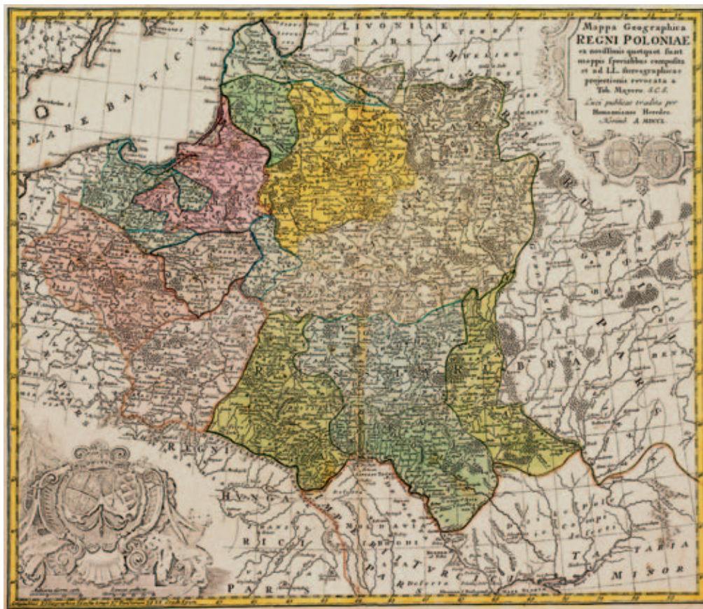
LENKIJOS KARALYSTĖS ŽEMĖLAPIS. SUD. J.T. MAYERIS. 1750

Šių ribų nepripažino Stalinas, 1939 m. sutartimi grąžinęs Lietuvai Vilnių ir 1940 m. Lietuvos stojimo į SSRS proga leidęs tik šiek tiek pakoreguoti rytines šalies ribas. Taigi šiandieninės nepriklausomos Lietuvos sienos nustatytos 1940 m.