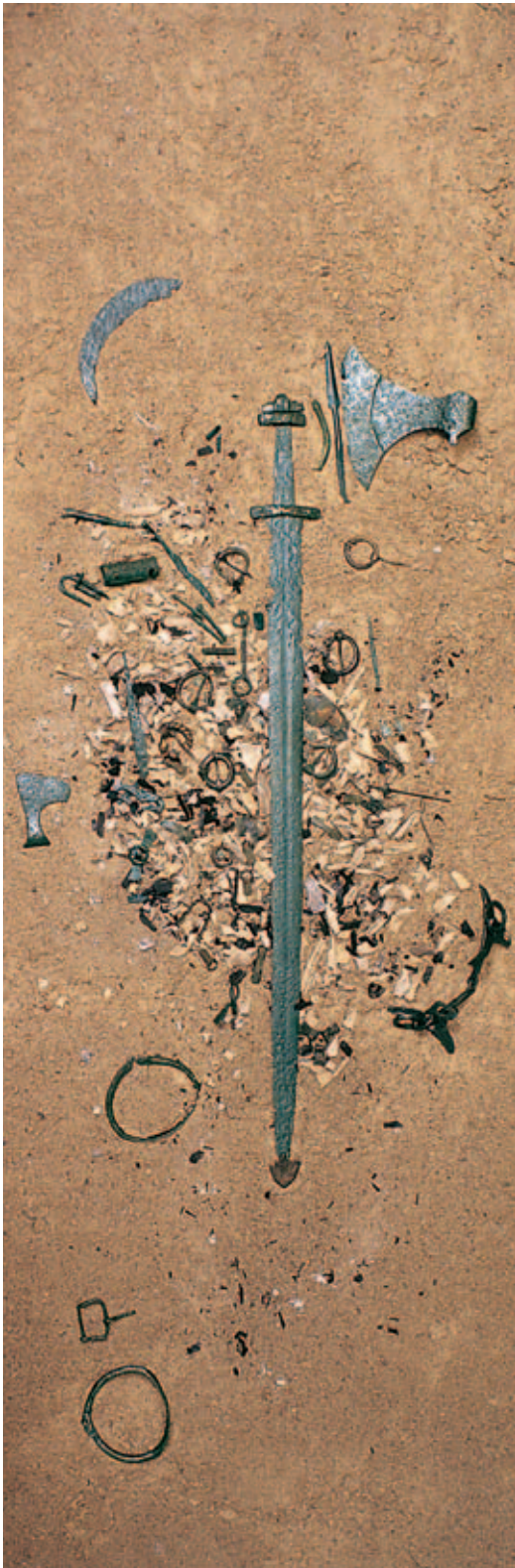
XI a. KURŠIŲ KARIO KAPAS. LAIVIŲ KAPINYNAS