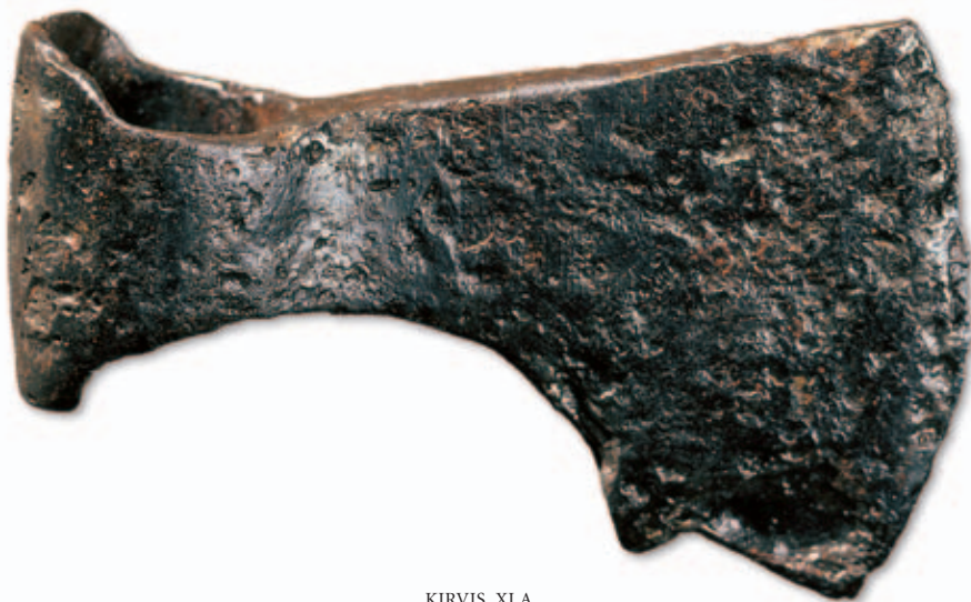
KIRVIS. XI A.

Lietuvos vardą pirmąkart užrašė ne patys lietuviai. Raštas, kaip ir plytos ar menas, – tai civilizacijos lygio požymis. Neturime nei to meto žmonių atvaizdų, nei mūro pastatų. Štai kodėl brangus kiekvienas archeologų radinys. Čia pateikiame kirvį, rastą netoli Elektrėnų, Perkūnkiemyje, – tokiu galėjo būti nužudytas šv. Brunonas. Panašius kirvius naudojo ir kuršiai. Tačiau lietuviai neturėjo tokių kalavijų kaip kuršiai (vienas jų rastas XI a. kario kape Laivių kapinyne, Kretingos r.), kuriuos pagrobę didžiavosi net vikingų vadai.