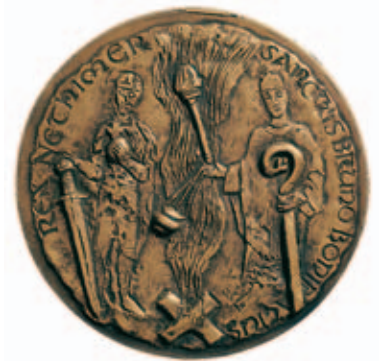
P. REPŠYS. LIETUVOS TUKSTANTMEČIO MEDALIS. 2001